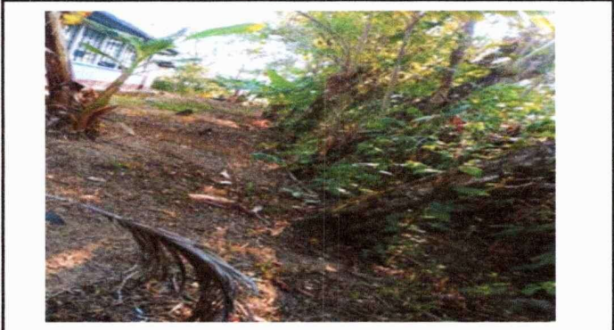
CERCO TRASERO DE LA ESCUELA, CAYENDOSE DEBIDO A DERRUMBES