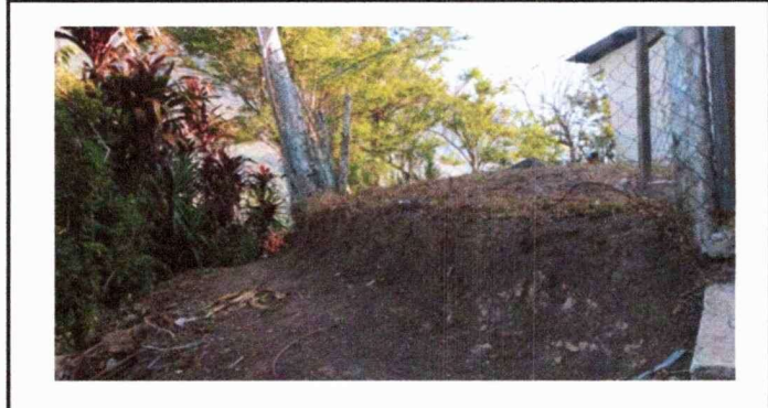
CERCO FRONTAL DE LA ESCUELA, DERRUMBANDOSE