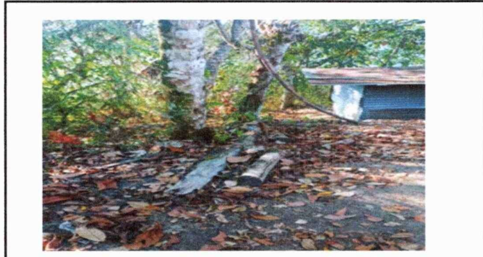
PARTE TRASERA DEL AULA NUMERO 1, A PUNTO DE COLAPSAR