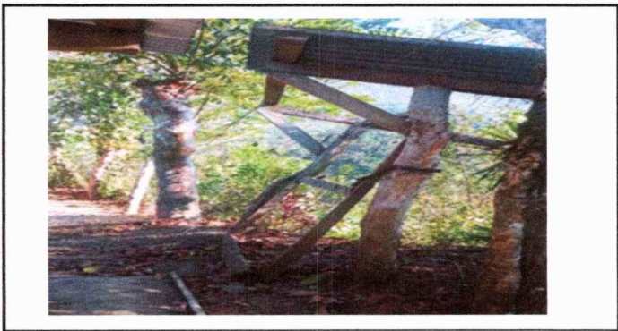
PARTE TRASERA DEL AULA IMPROVISADA CON PELIGRO DE DERRUMBARSE

Observación: Si es necesario se pueden agregar hojas adicionales y actualizar el número de hojas.