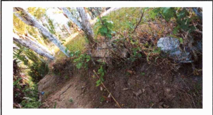
PARTE LATERAL DERECHA DE LA ESCUELA FORMAL